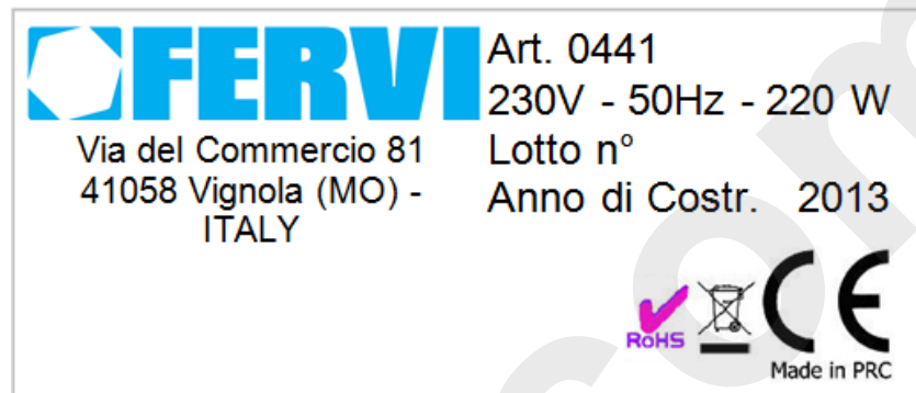
Figura 2 – Targhetta di identificazione