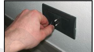
Figura 3 – Togliere la spina