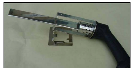
Figura 4 – Coltello appoggiato